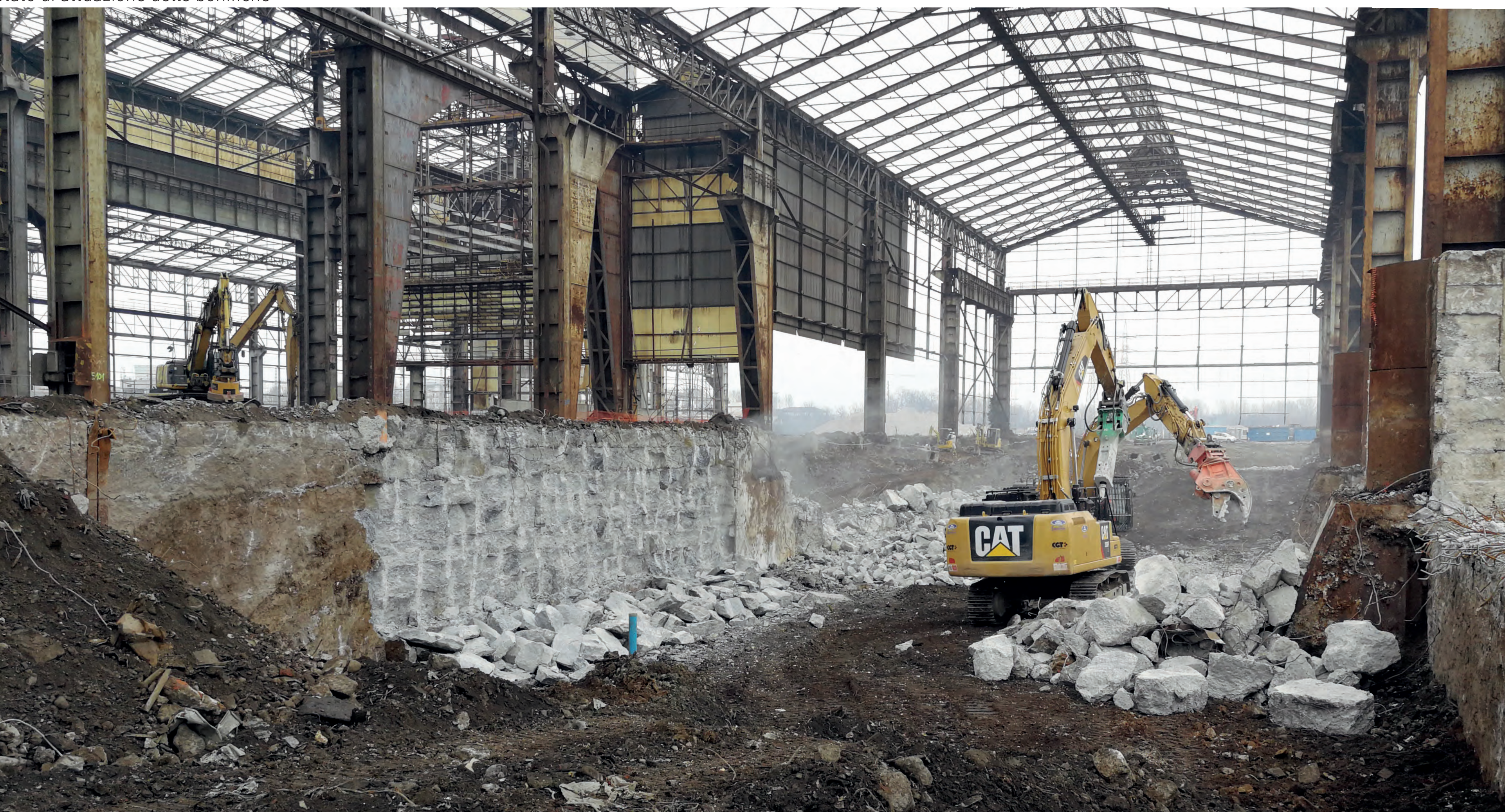
La fase di demolizione sotto il T5