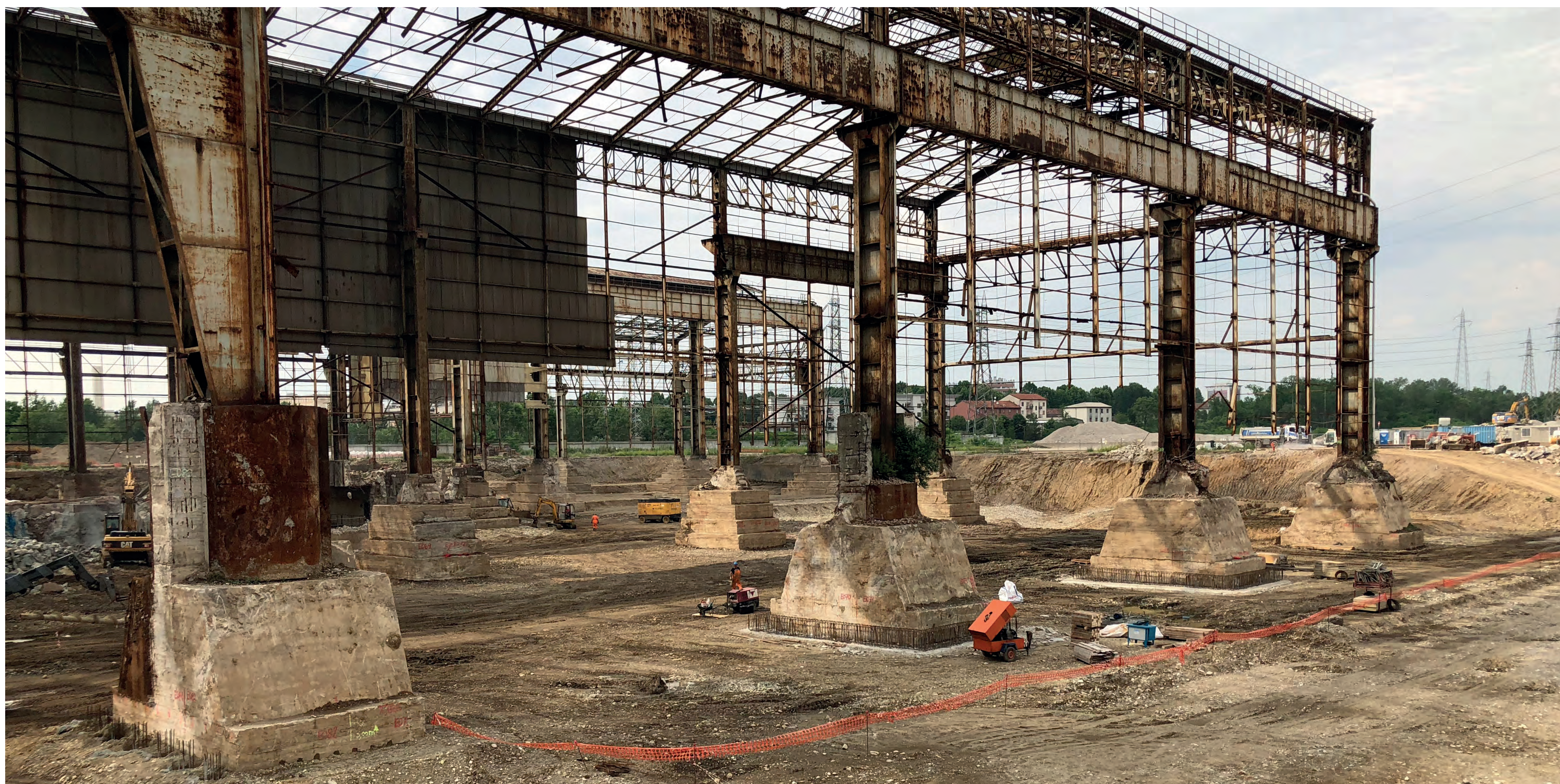
Gli scavi di bonifica nel comparto Concordia