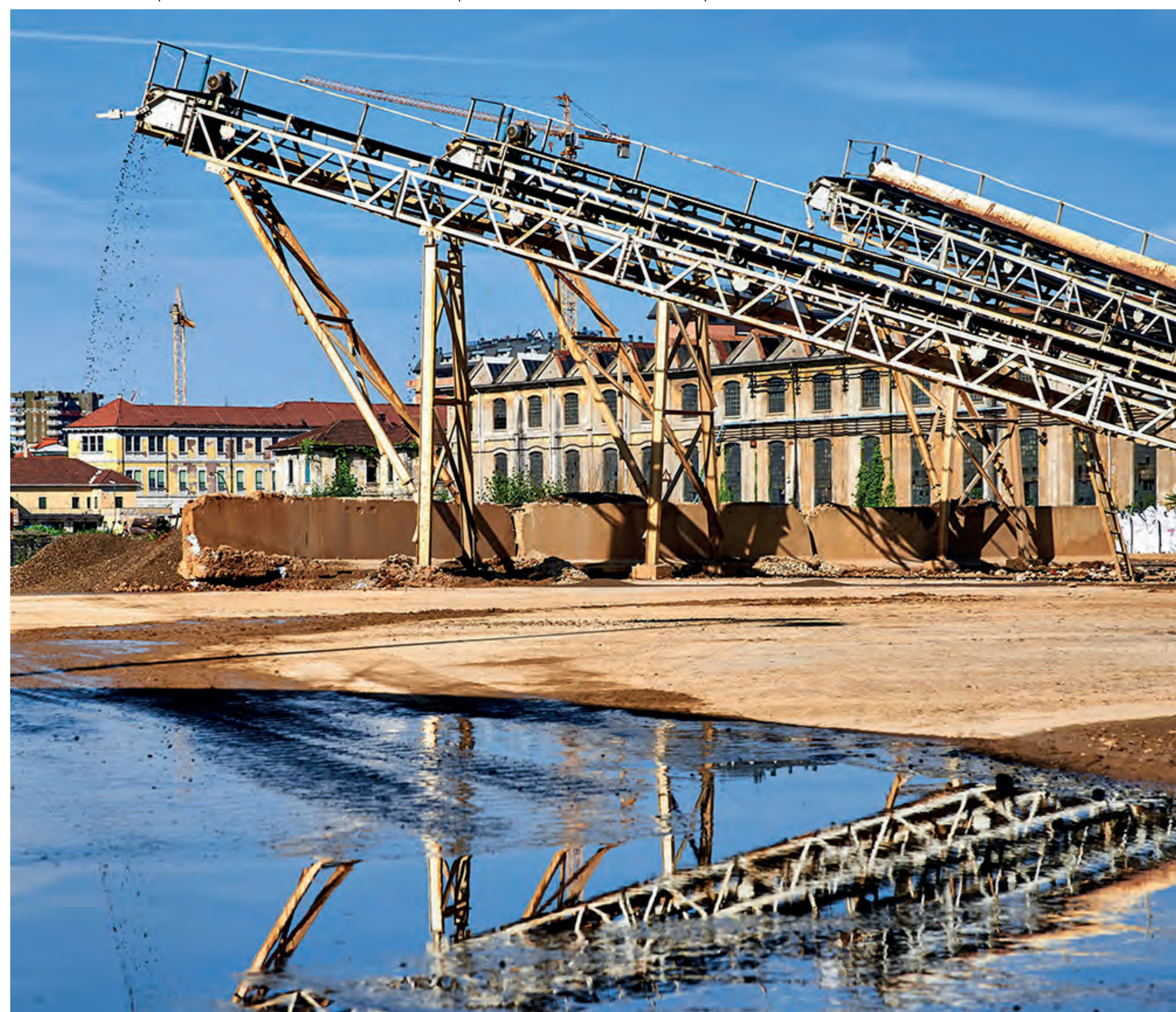
Le operazioni di bonifica nel comparto Unione