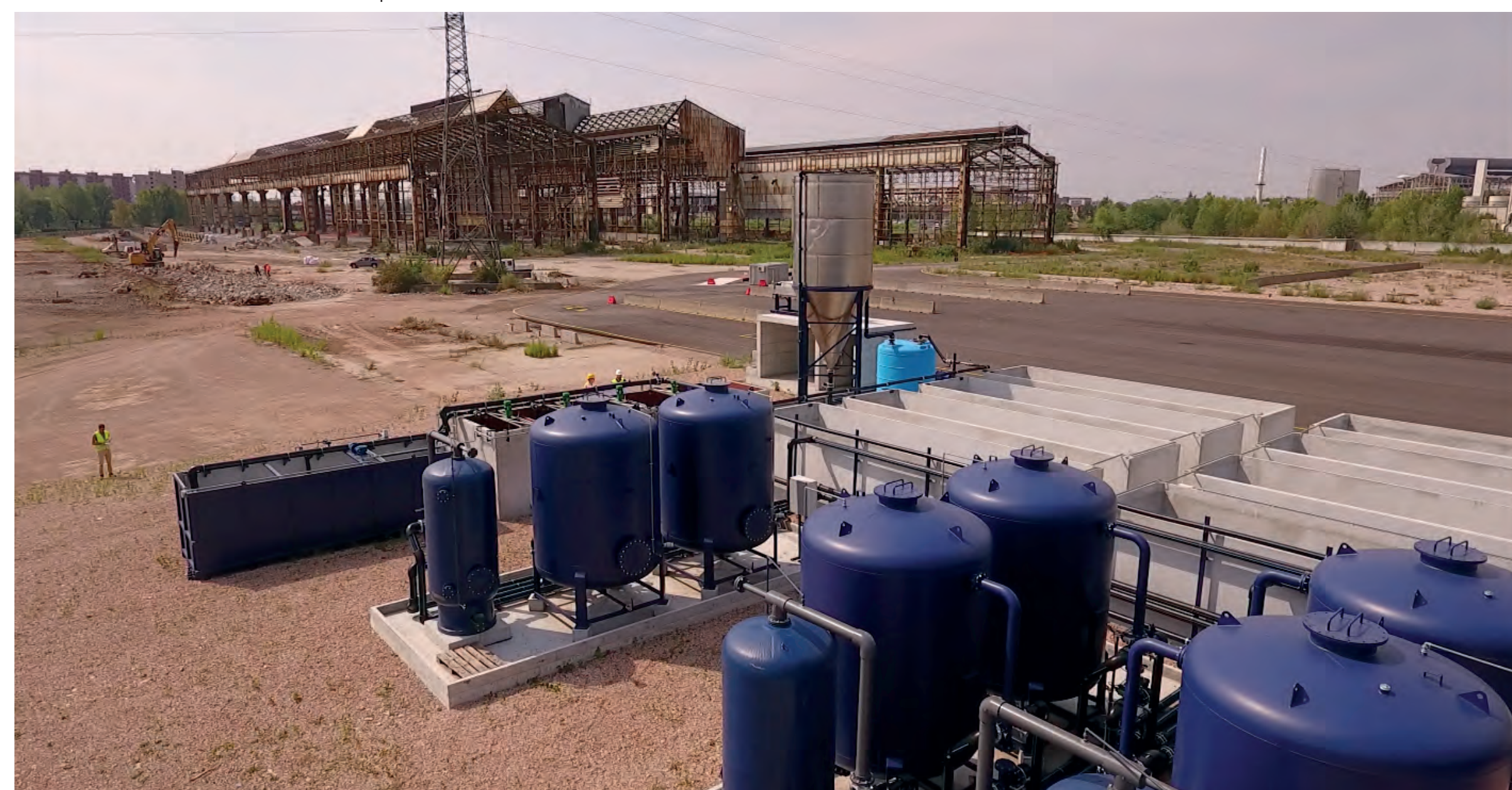
Impianto per il trattamento dell'acqua di falda nel comparto Concordia